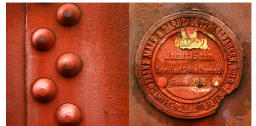
Fot. X. Zdjęcie do zadania "R"